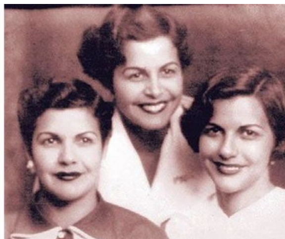
les 3 sœurs Mirabal